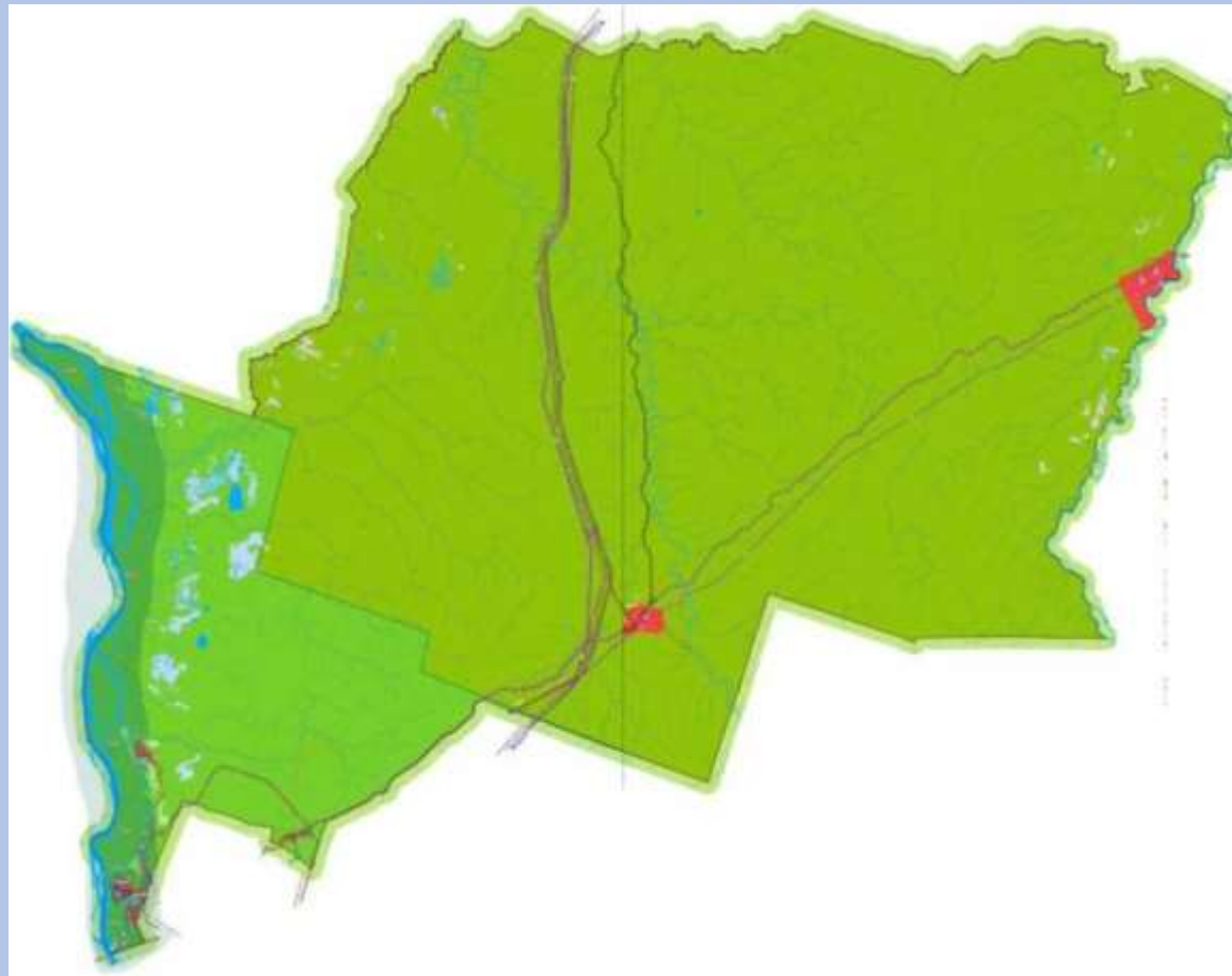
Рисунок 1 - Расположение городского поселения «Путеец» в структуре муниципального района «Печора» республики «Коми»